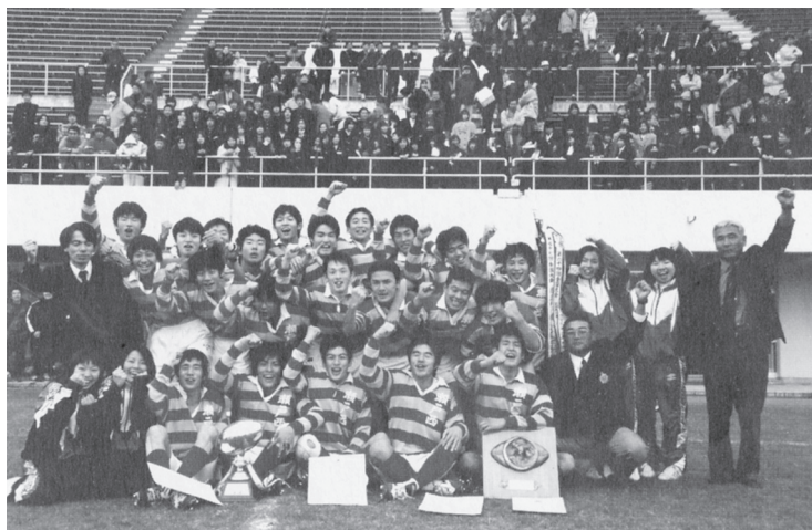
全国大会出場を決め喜ぶラグビー部員たち

西高生と愛知県高校ラグビー部員に感動を与え、努力すれば夢も実現できることを実証してくれた。しかし、全国大会の壁は厚く、善戦も空しく花園での1勝は次回へ持ち越された。今後、一層練習に励み、再度花園1勝に挑戦したい。最後に、花園出場に際しての協力金・応援等、本当にありがとうございました。